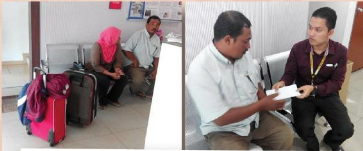
Sumbangan bantuan kewangan kepada sebuah keluarga gelandangan yang terputus belanja di Ipoh pada 07 Jun 2017.