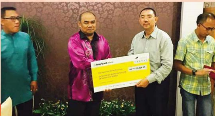
PENYERAHAN ZAKAT PERNIAGAAN PERCETAKAN NASIONAL MALAYSIA CAWANGAN PERAK PADA 09 OGOS 2017