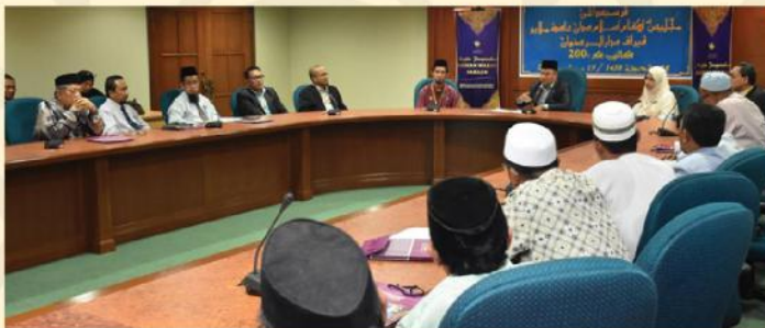
AGIHAN WAKAF SARAAN BAGI TAHUN 2017

Melihat kepada majlis yang berlangsung pada hari ini, telah menunjukkan salah satu objektif utama ibadah wakaf telah dilaksanakan dengan jayanya iaitu dengan berwakaf segala manfaat dan keuntungan hasil dari aktiviti-aktiviti ekonomi yang dijalankan dapat diagihkan semula untuk kebajikan umat Islam.