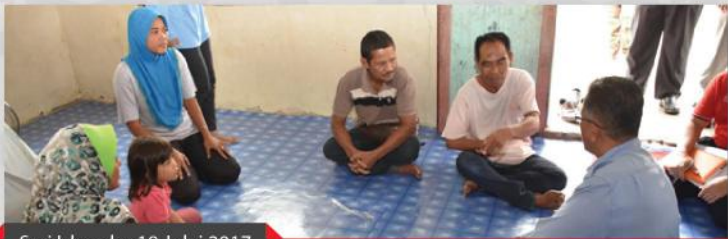
Seri Iskandar 18 Julai 2017