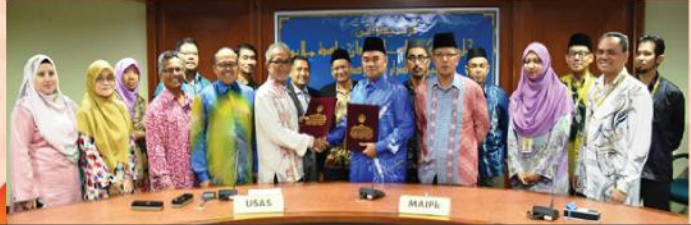
MAJLIS MENANDATANGANI PERJANJIAN USAHASAMA PENYELIDIKAN UNIVERSITI SULTAN AZLAN SHAH DAN MAIPk PADA 03 OGOS 2017