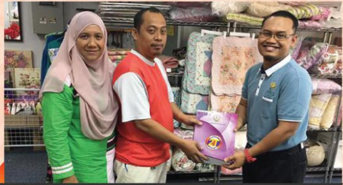
PROGRAM JEJAK PENIAGA DI KAMPAR DAN TANJUNG MALIM PADA 14 HINGGA 15 OGOS 2017