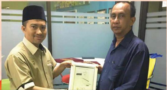
PENYERAHAN ZAKAT PERNIAGAAN KOPERASI PERMODALAN PEMUDA PERAK BERHAD PADA 20 SEPTEMBER 2017