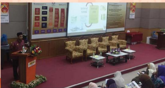
TAKLIMAT WAQAF PERAK AR – RIDZUAN DI IKM LUMUT, SERI MANJUNG PADA 15 OGOS 2017