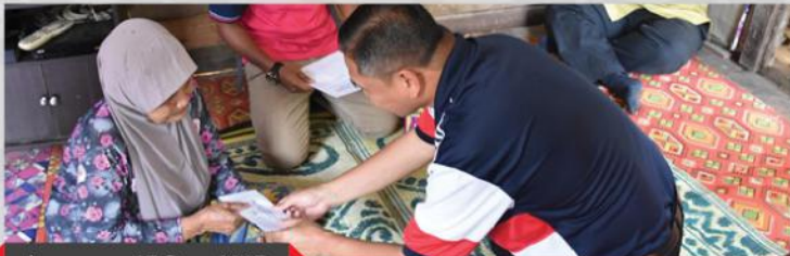
Lenggong 07 Ogos 2017