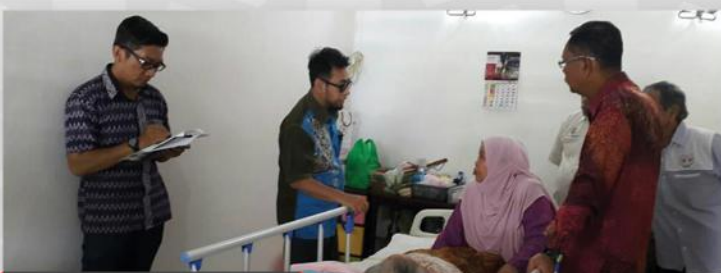
Manjung 28 September 2017