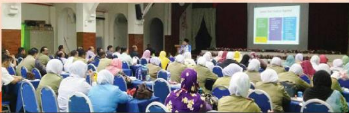
KURSUS FIQH ZAKAT DAN KAUNTER ZAKAT BERGERAK DI HOSPITAL ULU KINTA PADA 31 JULAI 2017