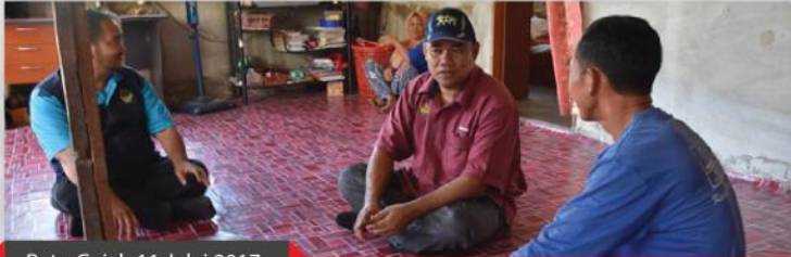
Batu Gajah 11 Julai 2017

MAIPK pada kali ini meneruskan program Jejak Asnaf untuk menyampaikan bantuan zakat secara terus kepada golongan asnaf. Program ini penting kepada MAIPK kerana secara langsung dapat melihat perkembangan kehidupan keluarga asnaf dan juga dapat mengeratkan siraturahim di antara MAIPK dengan golongan asnaf. Selain itu, program jejak asnaf ini dapat mendedahkan kepada masyarakat tentang iltizam serta peranan MAIPK sebagai sebuah institusi agama yang membantu masyarakat Islam di Negeri Perak.