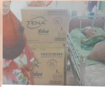
Sumbangan bantuan perubatan kepada Encik Jama Huri Samion di Kg. Sungai Tapah, Ipoh pada 15 Ogos 2017.