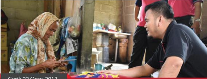
Gerik 22 Ogos 2017