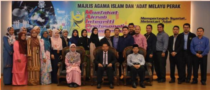
KURSUS INTERPRETASI DAN BENGKEL PENYEDIAAN DOKUMENTASI ISO PADA 10 JULAI 2017