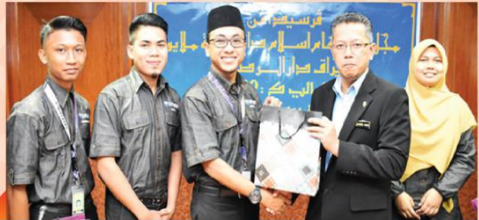
KUNJUNGAN HORMAT PELAJAR UNIVERSITI SULTAN AZLAN SHAH PADA 26 JULAI 2017